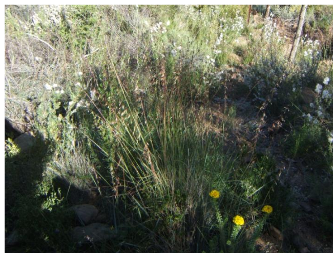
Die foto hierbo wys Ehrharta calycina in renosterveld naby Ladismith

Wanneer en hoe om te plant: Ontkiem slegs in koel, nat weer. Saai vanaf herfs tot winter (Mei-Augustus) Maak die grond los met 'n graaf of implement. Meng saad met dieselfde hoeveelheid kaf of saagsels. Om gelyke verspreiding te bekom, meet voorgename saai-area waar gesaai gaan word in kwart-hektaar blokke (100 m x 25 m) af en saai 1,5 kg saad (of 3 kg saad-kaf mengsel) op elke kwart-hektaar blok. Rol of vertrap die gesaaide gebied om die saad in die grond te druk, of hark die gesaaide gebied met 'n hark of 'n doringtak. Bedek die hele gesaaide gebied met doringtakke om die saailinge teen beweiding deur vee en wild te beskerm.