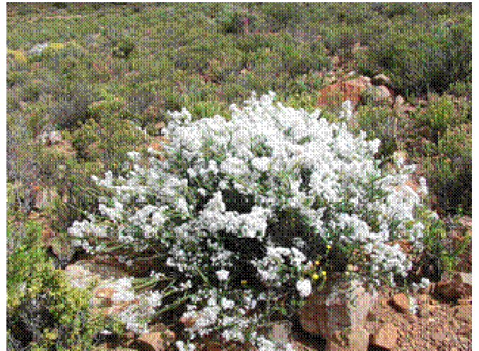
Plant in habitat

Hoe en wanneer om te plant: Saai in herfs, winter en lente in holtes of gesteurde (geploegde) grond, verkieslik met 'n deklaag van klippies.