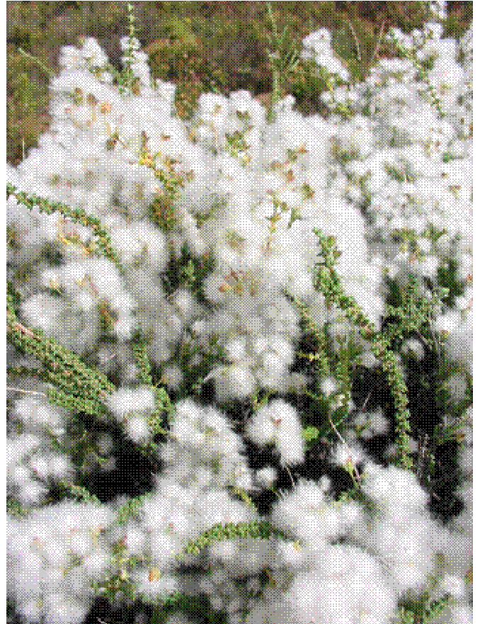
Wollerige "kapok" op 'n saaddraende plant