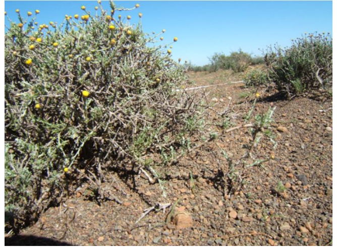
Volwasse plant met 'n tak wat anker.

Steggies met wortels : dit moet in nat grond geplant word na goeie reën in April tot Junie.