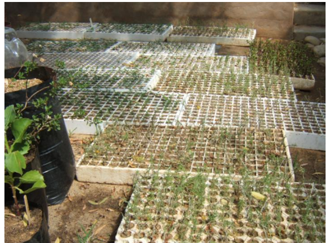
Steggie-bakke wat gereed is om in die veld geplant te word.