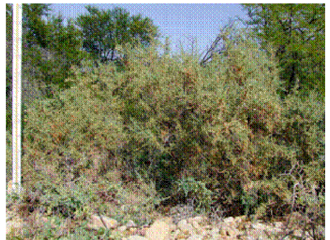
Volwasse rivierganna, Skaal: 1 decimeter