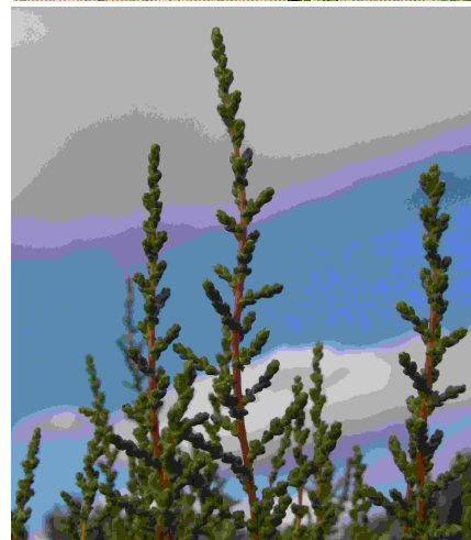
Kenmerkende rooi lote