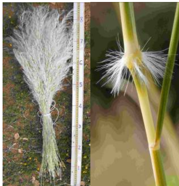
Links: Stipagrostis ciliata verkoop vir hersaai; Regs: harige tongetjie of "knetjie".

Hoe om te plant: maak die grond los met 'n graaf of implement. Bind bondels gras aan 'n stok vir windverspreiding, of strooi die halms losweg op die grond. Bedek die gebied met doringtakke, om te verhoed dat die grashalms wegwaai en om saaielinge teen beweiding deur vee en wild te beskerm.